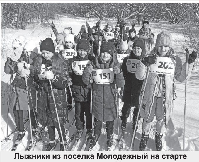
Лыжники из поселка Молодежный на старте