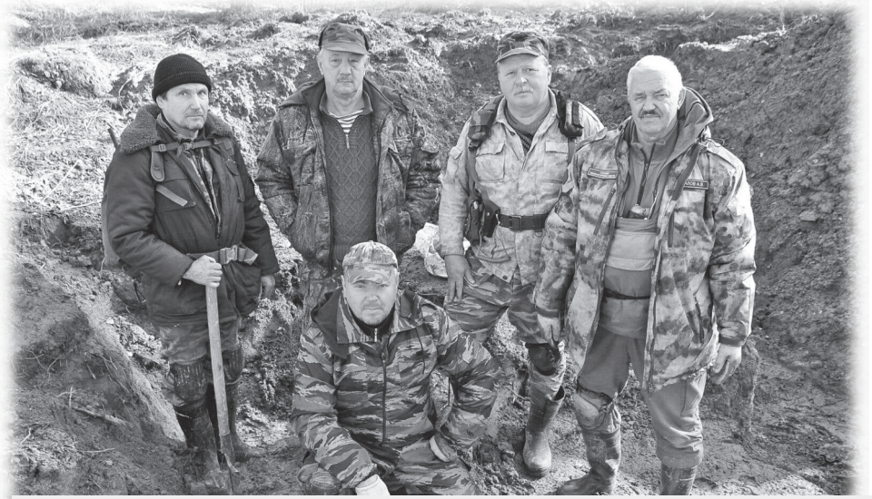
На месте поиска